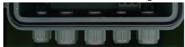
LINEA 220V (3x1mm 2 ) GRUPOS 1 y 3 (3x2,5mm 2 ) GRUPOS 2 y 4 (3x2,5mm 2 ) INYECC. AIRE (2x2,5mm 2 ) BATERIA 12V (3x2,5mm 2 )

¡ATENCIÓN NO DEBE UTILIZARSE MAS DE UNO DE LOS 3 BORNES. LOS DOS RESTANTES DEBEN QUEDAR SIN CONEXION.